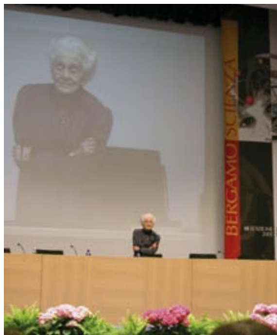
Rita Levi-Montalcini all'edizione di BergamoScienza 2005

organizzazione: IED Arti Visive - progetto di tesi: Video Design